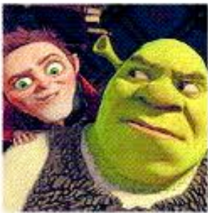
Shrek lässt sich mit dem fiesen Rumpelstilzchen ein.