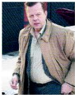
Inspektor Wallander ermittelt in einer Bauernhof-WG. Es gab Tote.

„Mankells Wallander – Heimliche Liebschaften“: Der Mord an einer Frau führt Kommissar Wallander auf die Spur ihres Liebhabers Micke Pettersson. Dieser lebt mit Frau und Freunden in einer Bauernhof-WG. Wallander glaubt, dass Pettersson seine Geliebte zum Schweigen bringen wollte, um seine Ehe zu retten. Doch dann wird Anki Hedman, ein WG-Kollege Petterssons, erschossen. Und der Killer hat weitere Mitglieder der Wohngemeinschaft im Visier. Wallander interessiert sich nun für die Finanzen der WG-Bewohner, die ein komfortables Leben führen, ohne zu arbeiten. Bei seinen Ermittlungen stößt er auf einen ungeklärten Raubüberfall. Der Krimi wird am Sonntag, 27. Juni, ab 21.45 Uhr auf ARD ausgestrahlt.